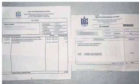
一年 271 令吉的商业执照费和招牌费，再加一年的按柜金。

他们指在士毛月新村，约有 50 间屋子改为店屋后，都没进行土地转换用途，相信其他新村也面对同样问题。 他们希望政府体恤人民，包括以分期付款方式让业主进行土地转换用途，若是 6 万令吉的土地拥有权转换费，可依年份摊还。