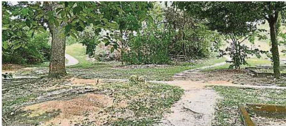
近期有露寶狂在公園捷徑騷擾優大女學生，令學生感到不安。

(加影9日訊)雙溪龍鎮優大校園附近出現露寶狂，專向女學生作出騷擾，令人感到十分不安。