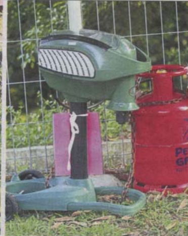
The mosquito magnet machine will be installed between Sekolah Agama Menengah Bestari Subang Jaya's teachers' quarters and the school.