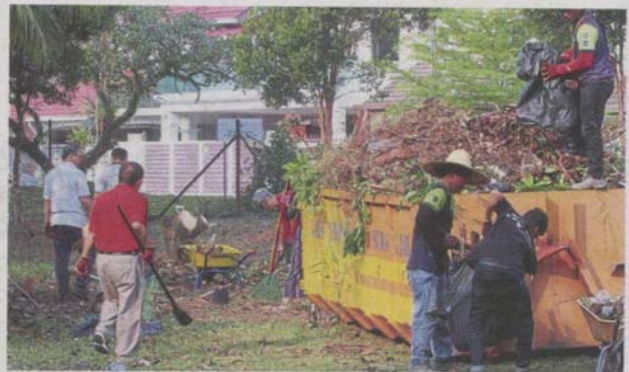
Volunteers taking part in a gotong-royong in USJ5.

Volunteers disposed of piles of dried rubbish, leaves and branches besides clearing blocked drains and stagnant pools that could potentially become breeding sites for