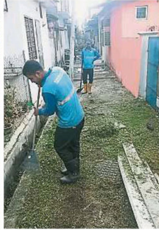
垃圾承包商员工正清理后巷。