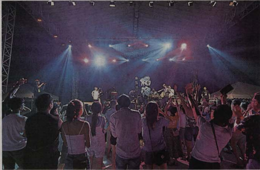
■热浪沙滩顿时变成演唱会摇滚区，现场观众气氛高昂。