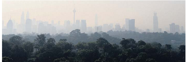
Pemandangan sekitar Kuala Lumpur yang diselimuti jerebu semalam.