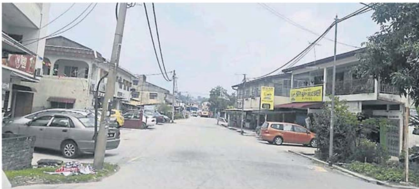
士毛月新村的业者或业主与其他新村业者一样，过去半年无法更新商业执照。