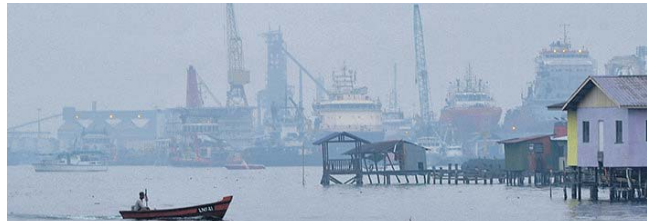
Pemandangan di perairan Kampung Air Patau-Patau Dua di Labuan berjerebu ketika tinjauan pagi semalam.