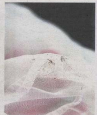
Mosquitoes are attracted to the odour emitted by the mosquito magnet machine.

She added that the situation could become an "uncontrollable epidemic" if mosquito-breeding grounds were not eliminated.