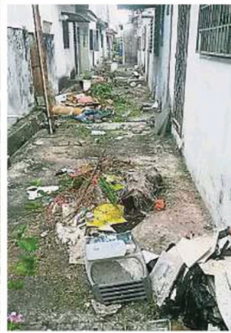
后巷垃圾堆积成山，影响周围环境卫生。