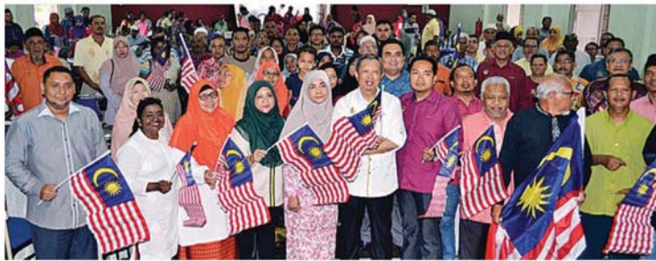
尼查 (左 6) 与全场民众共庆国庆日。

活动中，大会颁发了霹靂州政府提供500令吉的死亡抚恤金给8个家庭，同时也颁发奖学金及粮食盒给予贫困的民众。#