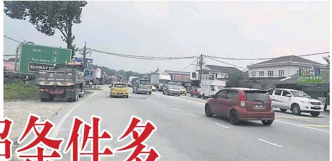
士毛月新村大路约 50 间屋子改为商业用途后，没进行土地转换用途手续。