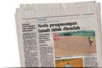
Keratan akhbar BH semalam.

BH kelmari dalam laporan eksklusif muka de-