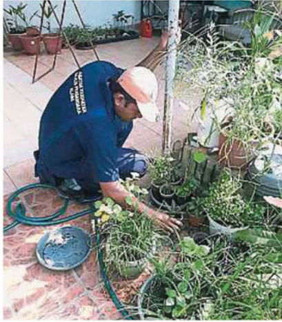
若执法人员在任何人住家处发现孑孓繁殖，便会对屋主或住户罚款1000令吉。

Provided for client's internal research purposes only. May not be further copied, distributed, sold or published in any form without the prior consent of the copyright owner.